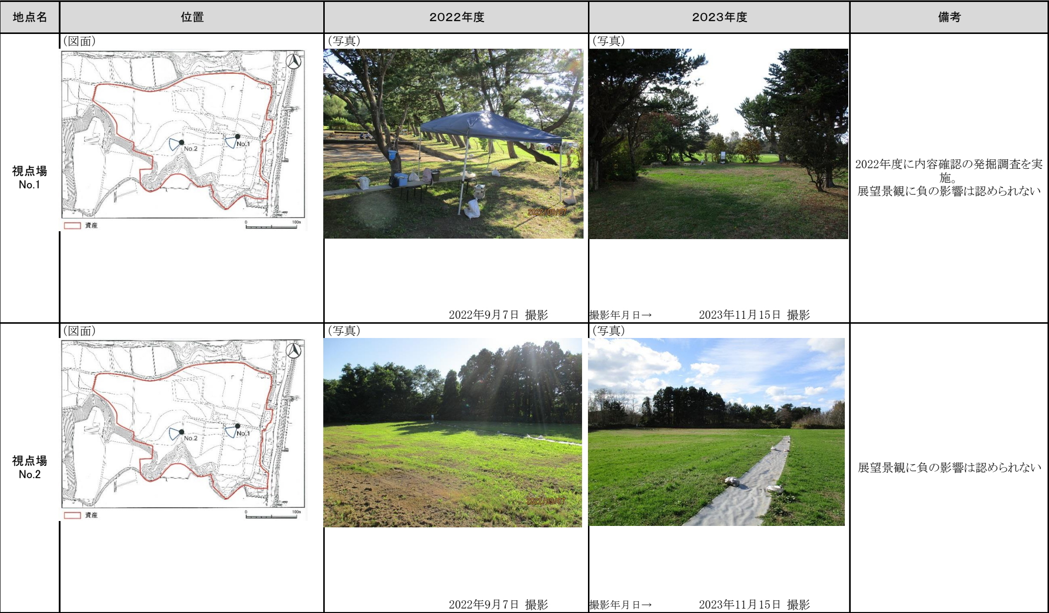
表10 構成資産の内外からみた眺望の観測